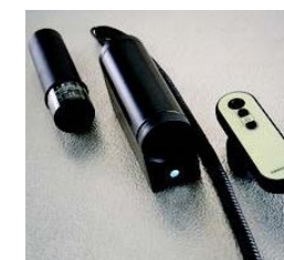
Batteri, styreboks og fjernbetjening.