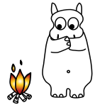
Ild og varme genstande skal undgås

Säskkieläimen adoptioon liittyy muutama sääntö. Tärkeimmät niistä kirjoitettu alas. Jos toimit sääntöjen mukaan, saat eläimen jolta saat paljon rakkautta. takuu raukeaa, jos sitä käytetään väärin. Koululaiset 5-10 vuotta suositeltava.