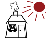
Dyrene skal være indenfor