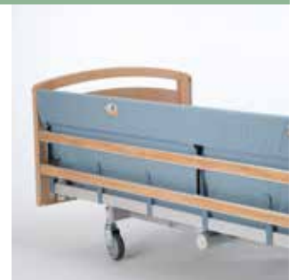
Polstret Polstret betræk til Line og Britt V sengehest. Betrækket bliver på plads når sengehesten er nedfældet. Leveres i polstret, ekstra polstret og forlænget (+100 mm og +200 mm).