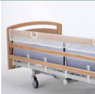
Betræk i net Betræk i net til Line og Britt V sengehest. Betrækket bliver på plads når sengehest er nedfældet. Leveres i standard og forlænget udgave (+100 mm og +200 mm).