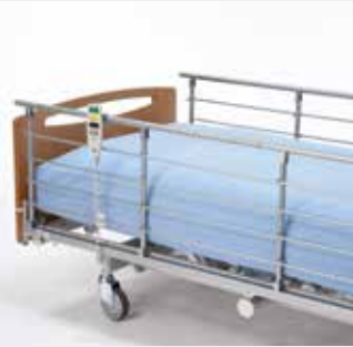
Invacare Scala Medium 2 Nedfældbar metalsengehest til høje madrasser (20 cm).*