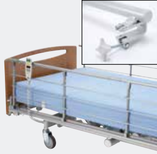
Invacare Scala Basic Plus 2 Nedfældbar metalsengehest med plastik indsats (15 cm).*