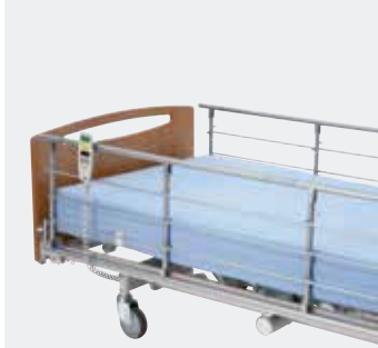
Invacare Scala Basic 2 Nedfældbar metalsengehest (15 cm).*