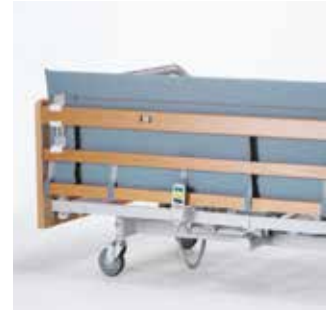
Forhøjet polstret betræk Polstret betræk til Line og Britt V med forhøjer.