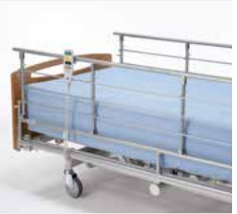
Invacare Scala Decubi 2 Nedfældbar metalsengehest til ekstra høje madrasser (25 cm).*