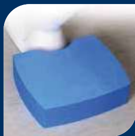
FOTPALL 10 CM