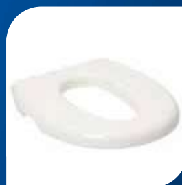
HÅLFÖRMINSKARE – till Bidette