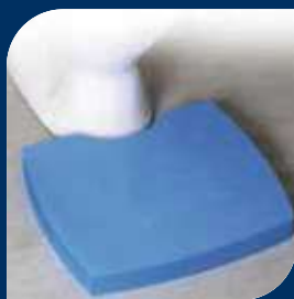
FOTPALL 5 CM

Fotkontakten är ett alternativ till handkontroll. Skall placeras på golvet. Kontakten ansluts till uttaget för handkontroll på fläkt-huset.