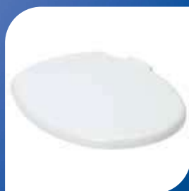
LÖST TOALETLOCK – till Bidette