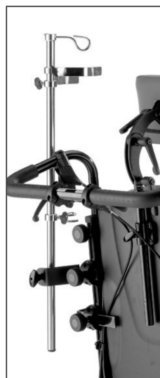
Dropstativ Bestillingsnr. 90118