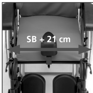
Meget små udvendige mål Fordelagtigt ved kørsel inden døre m.v. SB +21 cm.