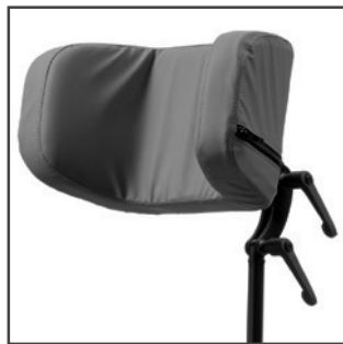
Hovedstøtte med sidesøtte Bestillingsnr. 90109