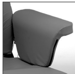
Armlæn med polstret sideplade Bestillingsnr. 90116-H/V