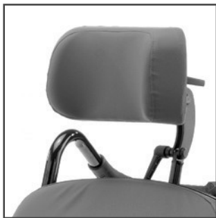
Hovedstøtte, standard Bestillingsnr. 90108