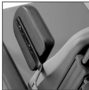
Kropsstøtter Bestillingsnr. 90111