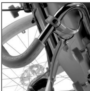
Tromlebremse og betjeningsgreb