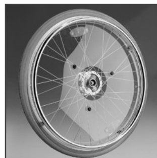
Egerbeskyttere 22" og 24" Bestillingsnr. 60113/60580