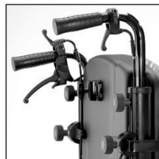
Højdeindstillelige skubbe- håndtag justerbar 10 cm.