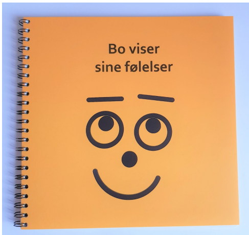
Bog: Bo viser sine følelser