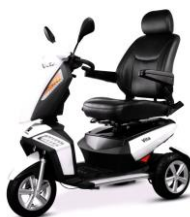
9996 Vita cityliner Hvid/orange