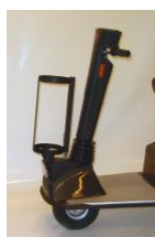
7760 Iltflaske-holder "enkelt"