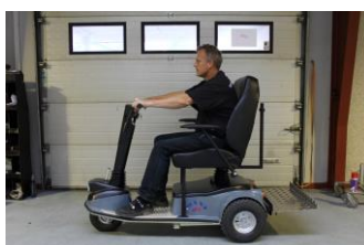
9992 Maxi 2000 Standard 160 kg.