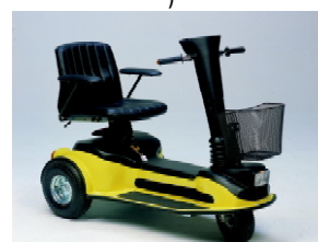
9986A Senior 2000 3