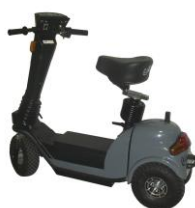
9999A City-Cruiser 2