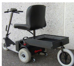
7717 Cargo lad m. hjul. t. translet