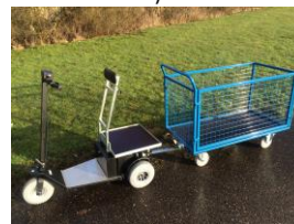
9998D Translet Cargo