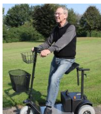
9998C Translet 3