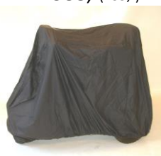
7753 Garageovertræk Kr. 588,-(735,-)