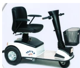
9985D Mini 2000 3