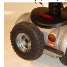
7756 Reservehjul (400x6") Kr. 935,-(1.168,75)