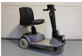
9909AF Jubi 2000 3