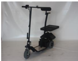
9998A Translet 0 "slim"