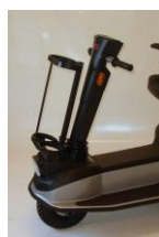
7761 Iltflaske-holder "dobb"