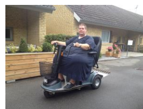
9992 Maxi 2000 xl sæde 300 kg.