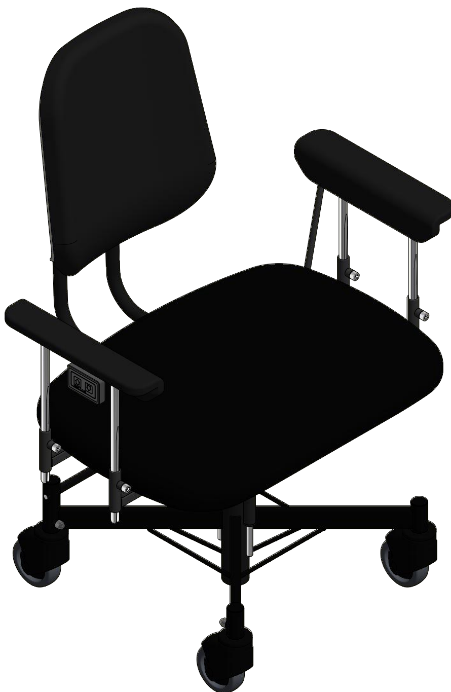
VELA Tango 310E